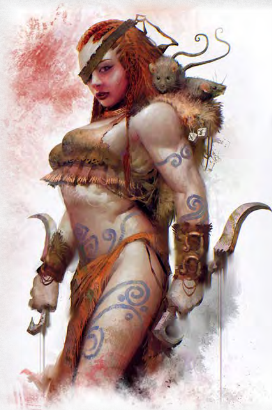
ニアヴ キャラクター・コマ用画像

ゲームを記録する際に使用する仕切りカードですが、ニアヴに対応するものではありません。記録の際は、はめ込んだトレーに対応する色の仕切りカードを使ってください。