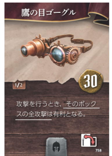
※攻撃ボックスへの効果