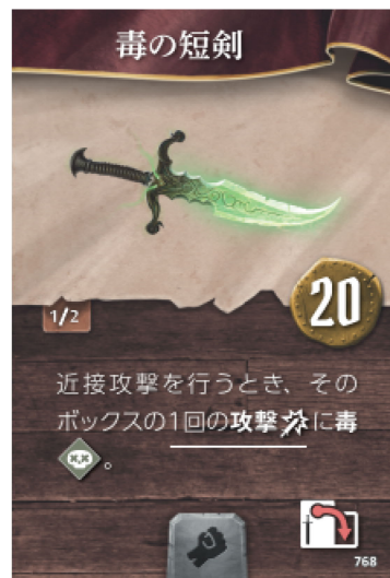
※1回の攻撃への効果

1回攻撃修正カードをめくるのが1回の攻撃。 たとえば標的を2つとったなら、それは2回の攻撃となる。